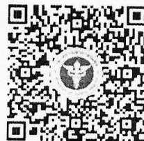
QR Code ตัวอย่าง Self Monitoring ของ รพ.