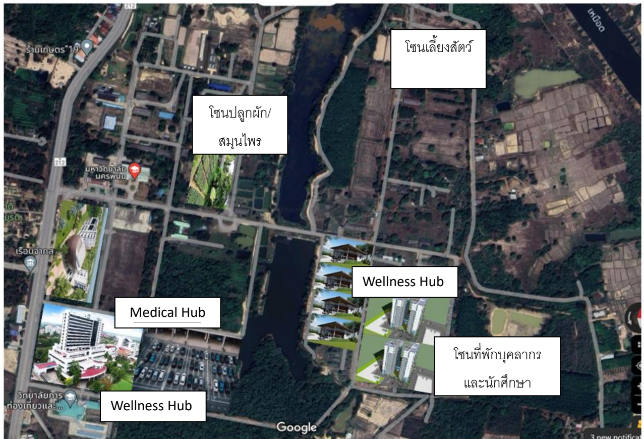
ภาพที่ 1 ผังตำแหน่ง Wellness Hub

อาคารศรีโคตรบูรณ์ คณะท่องเที่ยวและอุตสาหกรรมบริการ และโซนศรีโคตรบูรณ์ มหาวิทยาลัยนครพนม