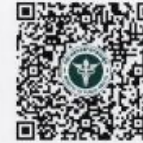
เอกสารแนบ ๒