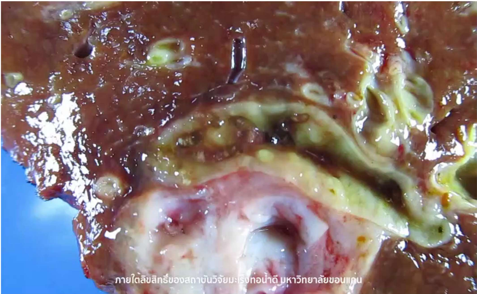
ภายใต้ลิขสิทธิ์ของสถาบันวิจัยมะเร็งท่อน้ำดี มหาวิทยาลัยขอนแก่น