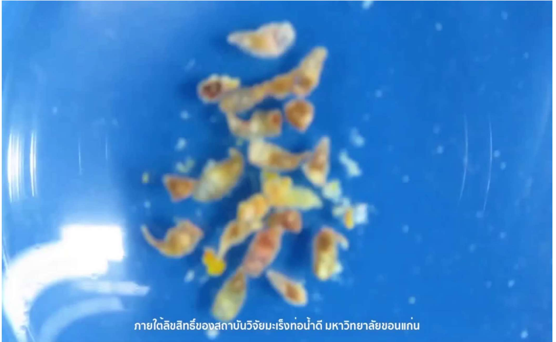
ภายใต้ลิขสิทธิ์ของสถาบันวิจัยมะเร็งท่อน้ำดี มหาวิทยาลัยขอนแก่น