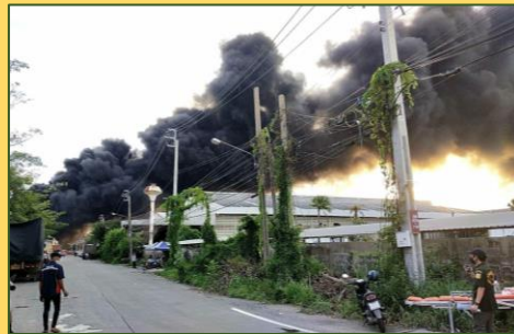
เหตุการณ์โรงงานหมิงตี้ระเบิด