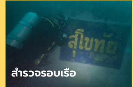
เหตุการณ์เรือหลวงสุโขทัยล่ม

กรณีที่ 4 ผู้ป่วยที่ยื่นฎีกาถึงเลขาธิการพระราชวัง