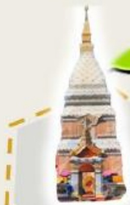
มระธาสุมรุกขมจร