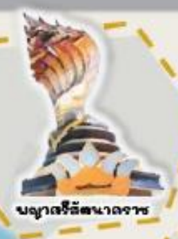
มณฑลวิศิษฐานาคาร