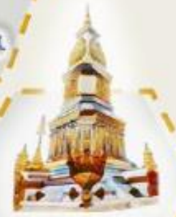
มระธาสุมรุกขมจร