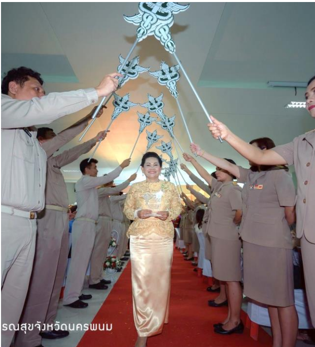
สว.สุจังหวัดนครพนม

เวลา 18.00 – 22.00 น. จำนวน 35 โต๊ะ (280 คน)