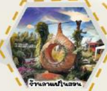
ร้านกาแฟในสวน