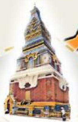
มระธาสุมรุกขม

โดย กลุ่มวิชาการแม่บทแห่งประเทศไทยและการแม่บทการท่องเที่ยว สำนักงานสาธารณสุขจังหวัดนครพนม