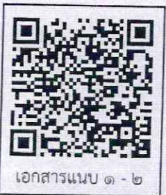
เอกสารแนบ ๑ - ๒

capitationปรับระดับ K1-2 - ต้นทุนการดำเนินงานจัดสรรในจังหวัด ยังขาดเงินในเขตบริการ ๑๖๖ ส.ค. ๖๔ ส่วน ๒๕ ส.ค. ๖๔ เวลา 12.๐๐ - จัดสรรเงินเพื่อไปใช้สัปดาห์